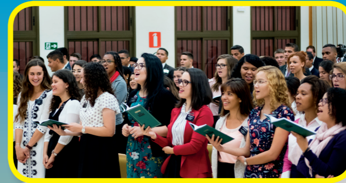
柯克長老夫婦拜訪了傳教士訓練中心，傳教士每天都分享著耶穌基督的光！