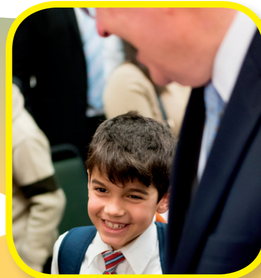
小孩很高興可以見到神的使徒！