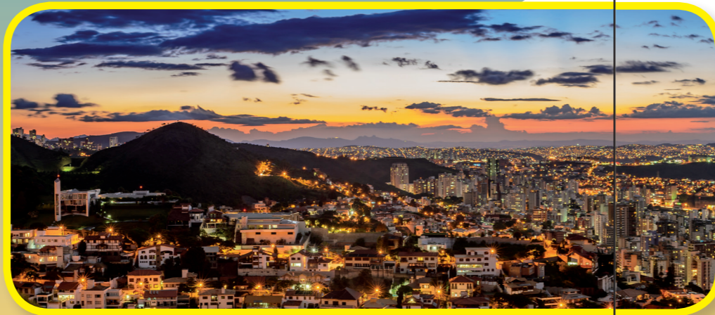
他們拜訪了培羅荷里桑大城，那城市名稱的意思是「美麗的地平線」。柯克長老說，這個城市擁有他見過最美麗的日落！