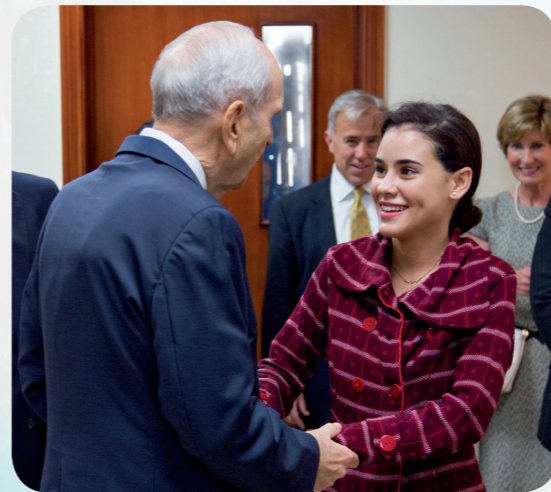
先知去年拜访了多明尼加共和国，用西班牙语对人民演讲。