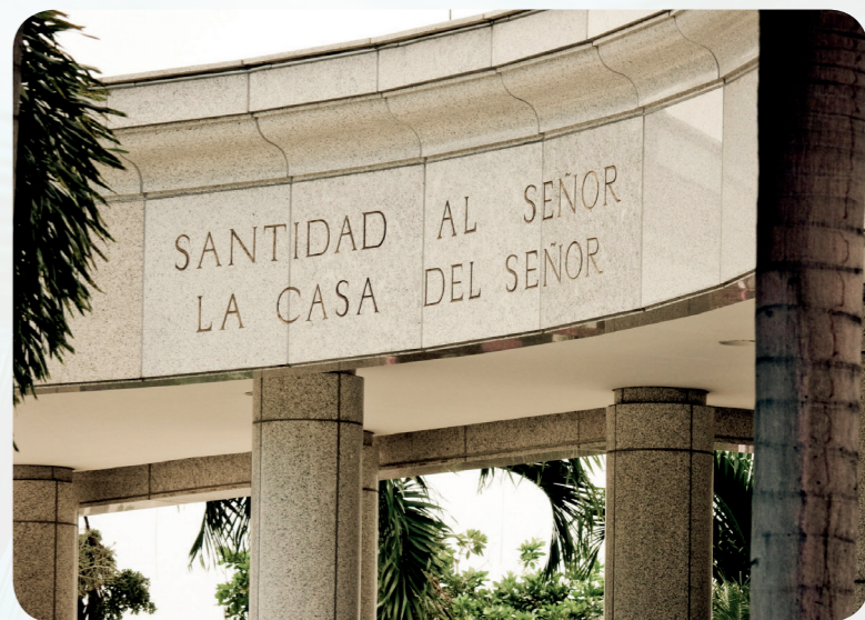
多明尼加共和国有一座圣殿，在圣多明哥市。圣殿上面写着：「Santidad al Señor: La Casa del Señor」意思是：「主的殿——归主为圣。」