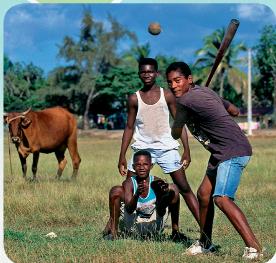
多明尼加共和国有很多小孩喜欢打棒球，这是他们国内最受欢迎的运动。

椰子、棕榈树、男孩打棒球的影像由GETTY IMAGES提供，插图：凯蒂·麦迪逊