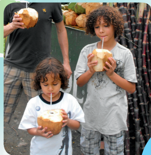
多明尼加共和国的人民吃很多种类的热带蔬菜和水果，这些男孩直接畅饮椰子汁！