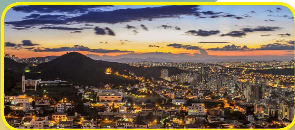
Binisita nila ang malaking lungsod ng Belo Horizonte. Ang ibig sabihin ng pangalan ng lungsod na iyon ay "magandang dako pa roon." Sinabi ni Elder Cook na mayroon itong pinakamagandang paglubog ng araw na doon pa lamang niyang nakita!

Kapag tayo ay ilaw, mas mabuti ang impluwensya natin sa mundo.