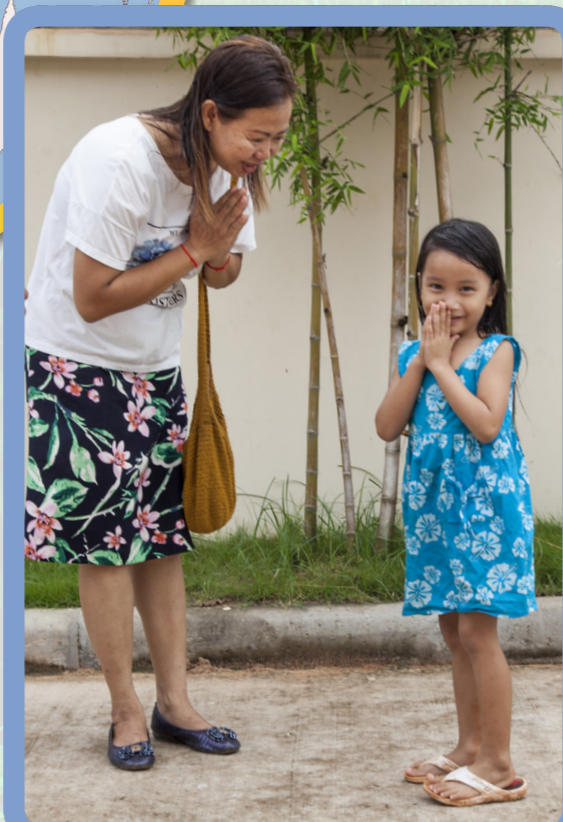
ФОТОГРАФІЯ ЧЛЕНІВ ЦЕРКВИ, ЯКІ ВІТАЮТЬ ОДНА ОДНУ, ТА ЧОЛОВІКА НА МОТОЦИКЛІ, ЗРОБЛЕНІ ДЖЕЙМСОМ ЛІФОМ ДЖЕФФРІ ІЛЮСТРАЦІЯ КЕЙТІ МАК-ДІ ФОТОГРАФІЯ ЧЛЕНІВ ЦЕРКВИ, ЯКІ ГОТУЮТЬ ЇЖУ, ЗРОБЛЕНА СЕЛІНО ДЖЕФФРІ

Ці члени Церкви вітають одна одну за камбоджійською традицією, яка називається сампхін . Чим вище підняті ваші руки, тим більшу повагу ви виявляєте.