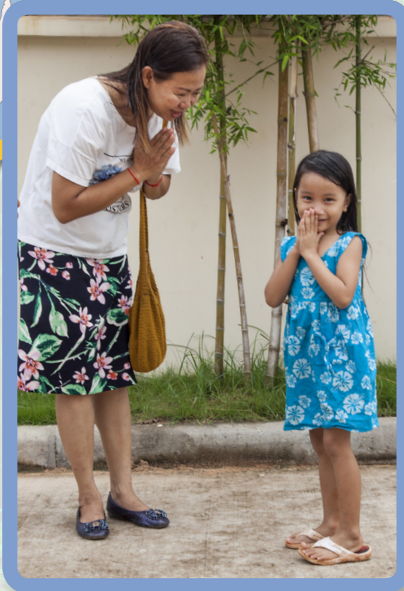
ATA PUE O TAGATA LOTU O LOO FAAFEILOAI I LE TASI MA LE ISI MA LE ALI I LUGA O LE UILA AFI NA SAUNIA E JAMES ILIFF JEFFERY ATA NA TUSIA E KATIE MIDDE ATA PUE O TAGATA O LOO RUKA MEAAI NA SAUNIA E CELIA JEFFERY

O loo faafeiloai e tagata o le Ekalesia le tasi ma le isi i ala masani faaKemupotia, e taua o le sampeah . O le maualuga lava o ou lima, o le tele foi lea o lou faaalua o le faaalolo.