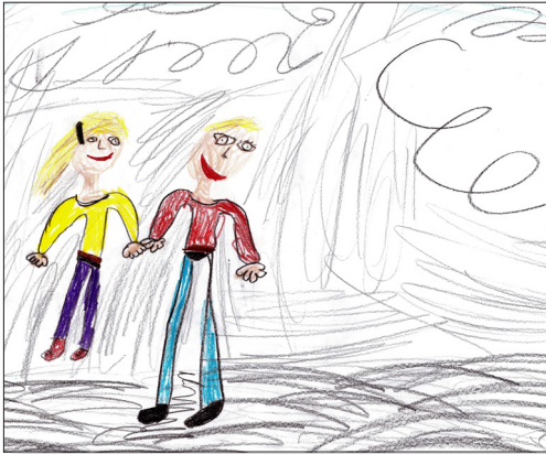
'Alisipeta K., ta'u 7, Vahefonua Siliní, Lepupelika Sekí