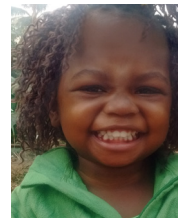
Telesikā J., ta'u 6, Vahefonua Siliní, Lepupelika Sekí

Ko e fānau au 'a e 'Otuá. 'Okú ne 'ofa 'iate au.