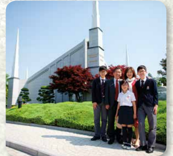
Tämä perhe on käymässä Soulin temppelissä. Se vihittiin käyttöön vuonna 1985 Etelä-Korean pääkaupungissa.