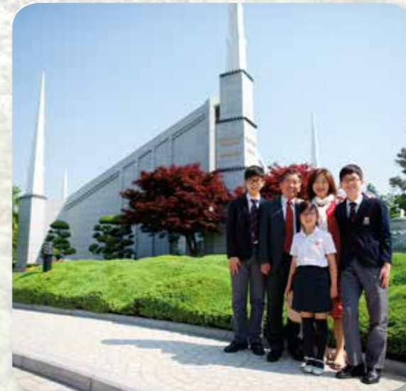
Diese Familie besucht den Tempel in Seoul, der Hauptstadt Koreas. Er wurde 1985 geweiht.