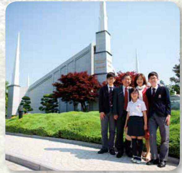
Questa famiglia sta visitando il Tempio di Seul. È stato dedicato nel 1985 nella capitale della Corea del Sud.