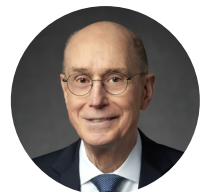
Presidente Henry B. Eyring Segundo conselheiro na Primeira Presidência