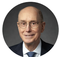
Præsident Henry B. Eyring Andenrådgiver i Det Første Præsidentskab