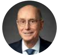
Presidentti Henry B. Eyring toinen neuvon- antaja ensimmäi- sessä presidentti- kunnassa