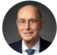
Írta: Henry B. Eyring elnök második tanácsos az Első Elnökségben