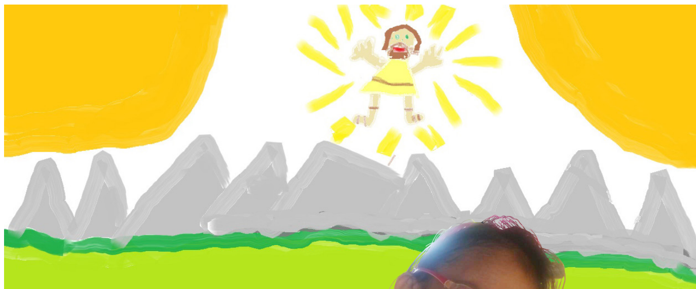
塔魯斯，9歲，美國維吉尼亞州