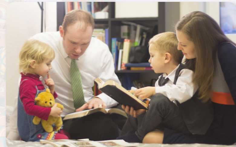
Letztes Jahr hat Präsident Nelson verkündet, dass in Russland ein Tempel gebaut werden wird. Die Mitglieder der Kirche in Russland haben sich sehr gefreut! Es wird der erste Tempel in diesem riesigen Land sein.

Danke, dass du auf unserer Reise durch Russland dabei warst! Bis zum nächsten Mal!