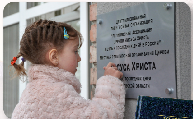
Das russische Alphabet besteht aus kyrillischen Buchstaben. Das ist ein Schild an einem Gebäude der Kirche in Russland und ein Buch Mormon auf Russisch.