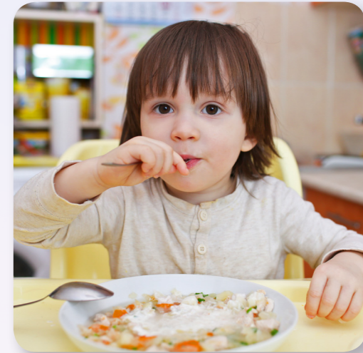
Suppe ist in Russland sehr beliebt! Dieser Junge isst eine Kohlsuppe, die Schtschi heißt.