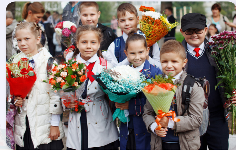
In Russland heißt der erste Schultag „Wissenstag“. Die Kinder singen, tanzen und schenken ihren Lehrern Blumen.