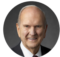
Presidente Russell M. Nelson