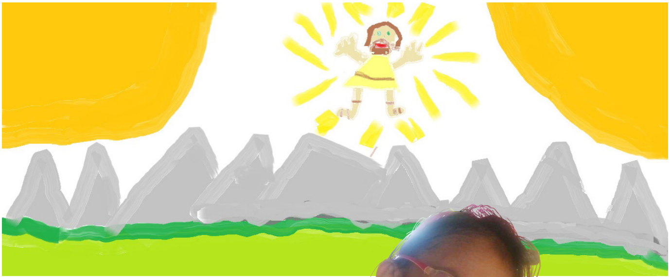
ทาลัส ที. อายุ 9 ขวบ รัฐเวอร์จิเนีย สหรัฐอเมริกา

ท นุรู้ว่าพระเจ้าทรงพระชนม์และพระองค์ทรงสละพระชนม์ชีพเพื่อพวกเรา หนูรู้ว่าพระเจ้าทรงเป็นพระเจ้าผู้ช่วยให้รอดและพระเจ้าผู้ไถ่ของเรา มาเรีย อายุ 10 ขวบ