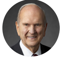
โดย ประธาน รัสเซลล์ เอ็ม. เนลสัน