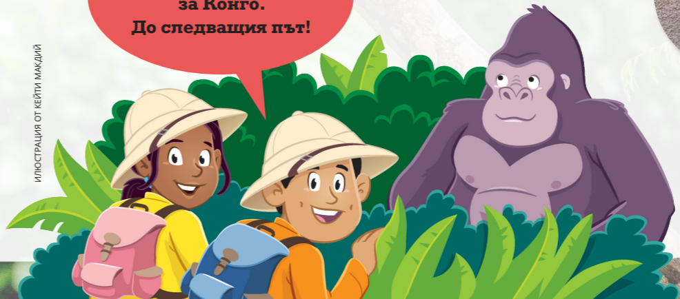
ИЛЮСТРАЦИЯ ОТ КЕЙТИ МАКДИИ

Ти от Конго ли си? Пиши ни! Ще се радваме да научим за теб. Вж. с. П24.