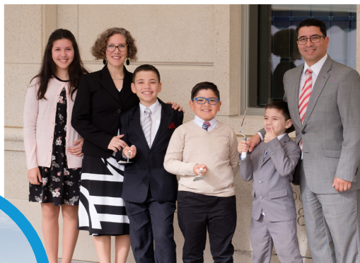
Ang mga bata miabut uban sa ilang mga ginikanan aron maminaw ni Presidente Nelson nga mohatag sa espesyal nga pag-ampo sa pagpahinugod sa templo.