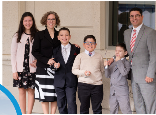
A roko ataei ma aia karo n ongora te tataro iroun Beretitenti Nelson ae onoti ae anga ni katabua te tembora.