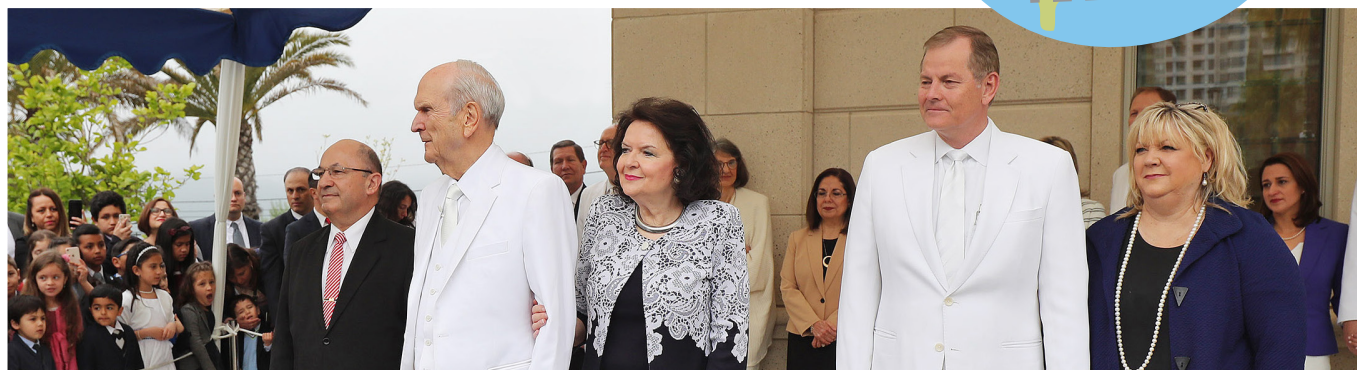
Ахлагч Гари И.Стивэнсон, Лиза Стивэнсон эгч хоёр ерөнхийлөгч Рассэлл М.Нэлсон, Вэнди Нэлсон эгч хоёртой хамт маш чухал үйл явдалд оролцохоор Чили руу аялсан байна. Консепшон хотод шинэ ариун сүм онцгойлон адислагдах гэж байлаа!

Энэ гайхалтай шинэ ариун сүм бол Чилид баригдаж байгаа 2 дахь, Өмнөд Америкт баригдаж байгаа 18 дахь ариун сүм юм.