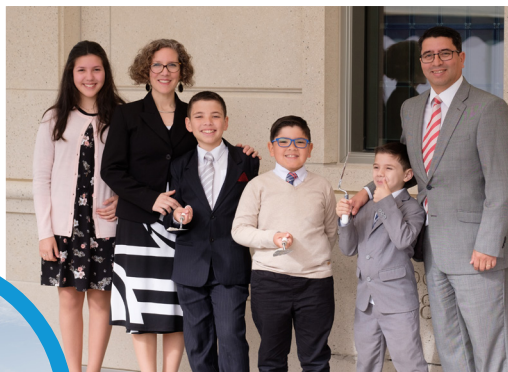
Anak-anak datang bersama orangtua mereka untuk mendengar Presiden Nelson memberikan doa khusus untuk mendedikasikan bait suci.