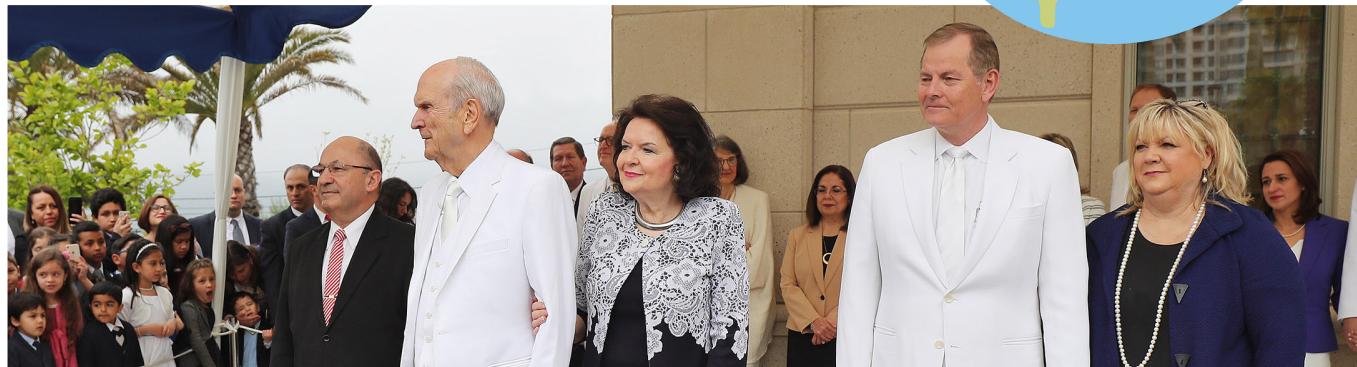
Naglakbay sina Elder Gary E. Stevenson at Sister Lesa Stevenson kasama sina Pangulong Russell M. Nelson at Sister Wendy Nelson sa Chile para sa isang napakahalagang kaganapan. Isang bagong templo ang inilaan sa lungsod ng Concepción!

Ang magandang bagong templo ang pangalawang itatayo sa Chile at ika-18 na templo sa South America.