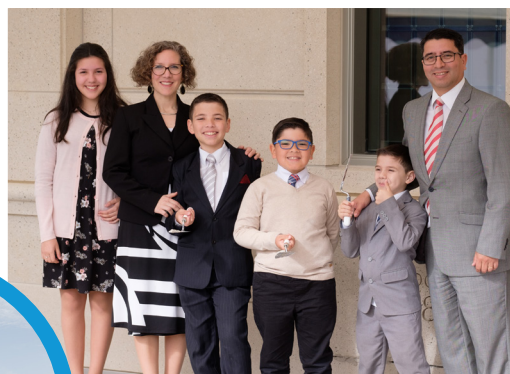
Nagdatingan ang mga anak kasama ang kanilang mga magulang para marinig ang espesyal na panalangin ni Pangulong Nelson para ilaan ang templo.