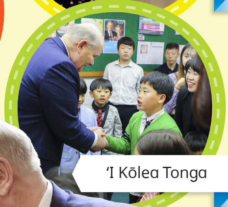
'I Kōlea Tonga

“'Okú ke fie 'ilo nai ki ha ki'i fakapulipuli? Ko e makasini 'a e Siasí 'oku ou manako taha aí ko e Kaume'á . 'Oku ou 'ulu-aki lau ma'u pē ia!”