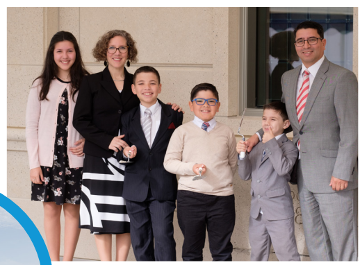
Các em thiếu nhi đi cùng cha mẹ lắng nghe Chủ Tịch Nelson dâng lên một lời cầu nguyện đặc biệt để cung hiến ngôi đền thờ.

Ngôi đền thờ mới đẹp đẽ này là ngôi đền thờ thứ hai được xây cất tại Chile và là đền thờ thứ 18 tại Nam Mỹ.