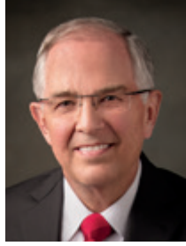
ニール・L・アンダーセン