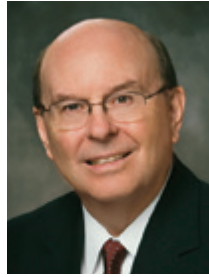
クエンティン・L・クック