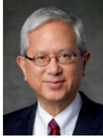
ゲレット・W・ゴング