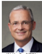
パトリック・キアロン