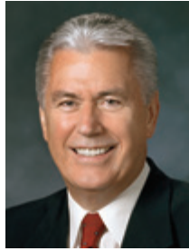
ディーター・F・ウクトドルフ