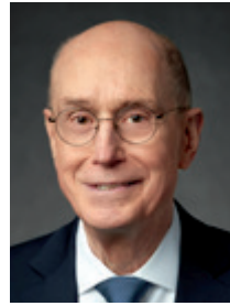
第二顧問 ヘンリー・B・アイリング