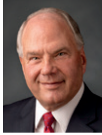
ロナルド・A・ラズバンド