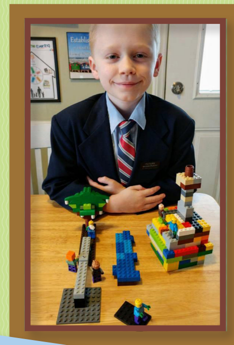
"Pema e Jetës", Rasëll K., 8 vjeç, Karolina e Veriut, SHBA