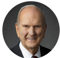
Nga Presidenti Rasëll M. Nelson