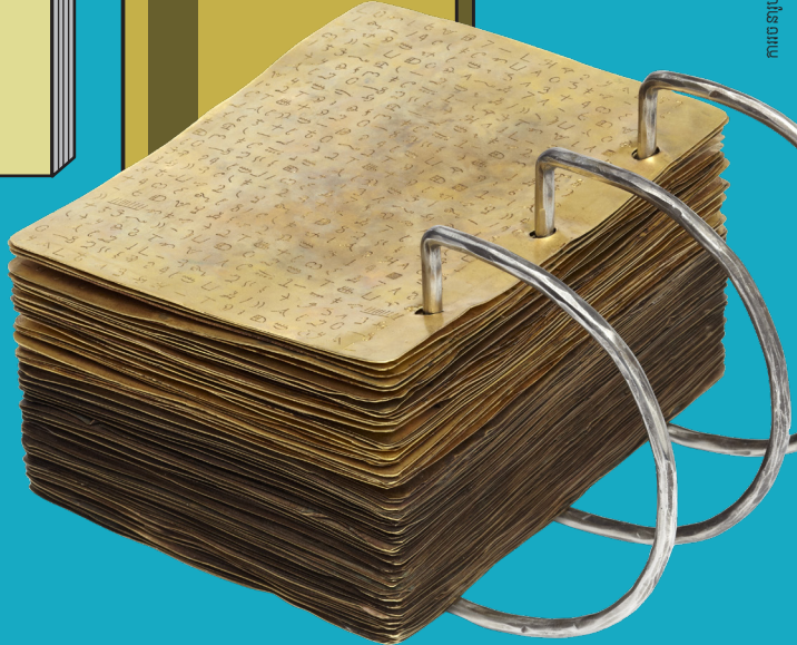
ការចេញប្រកាសនៃយ៉ូសែប ស្ទីវ និងទេវតាមន្ទីរណែ ដោយ ប្រាយអិន ប៊ិច