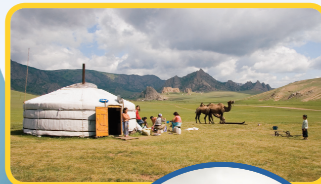
Andere gezinnen wonen op het platteland. Ze wonen in tenten, die ze gers noemen, en ze hoeden onder andere jaks, paarden en kamelen.