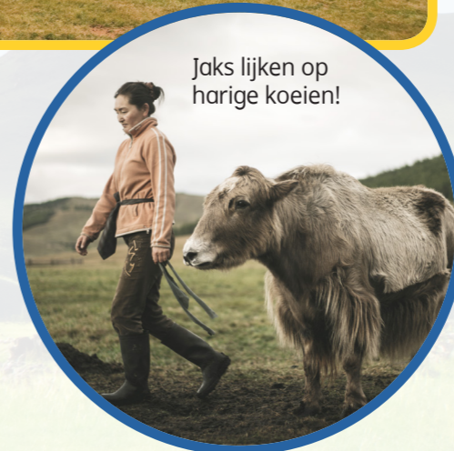
Jaks lijken op harige koeien!