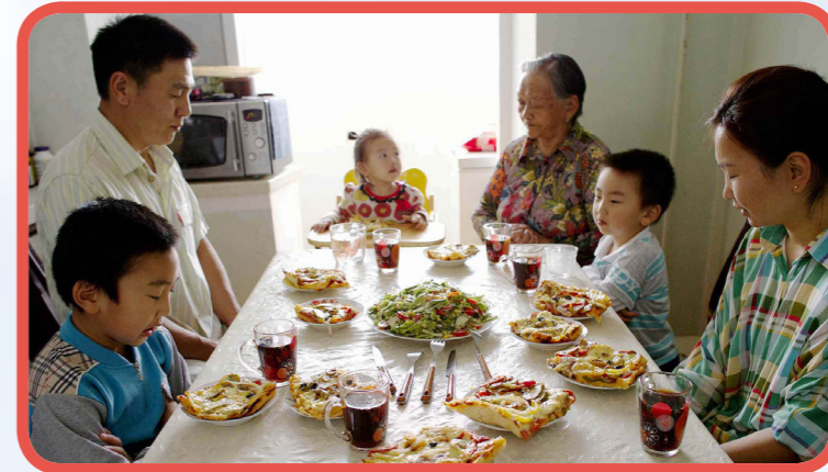
Veel Mongoolse gezinnen wonen in de hoofdstad, Ulaanbaatar.