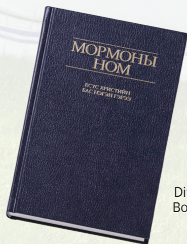
Dit is het Mopmohpi Hom , het Boek van Mormon.

In Mongolië zijn meer paarden dan mensen! Tijdens Mongoolse volksfeesten kun je paardrijden, boogschieten, worstelen, dansen en lekker eten.