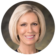
Saunia e Sister Joy D. Jones Peresitene Aoao o le Peraimeri