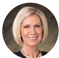
Søster Joy D. Jones Primarys hovedpræsident