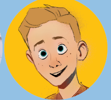
ILLUSTRATION VON JARED MATTHEWS

B evor die Kirche wiederhergestellt wurde, glaubten die Menschen, wenn jemand in ihrer Familie ungetauft starb, würden sie ihn nie wieder sehen. Aber dank der Wiederherstellung können wir uns im Tempel für unsere Vorfahren taufen lassen. Wir können für die Ewigkeit aneinander gesiegelt werden!