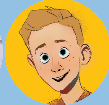
ILLUSTRATION JARED MATTHEWS

I nnan kyrkan återställdes trodde människorna att om någon i deras familj dog utan att ha blivit döpt så skulle de aldrig få se honom eller henne igen. Men tack vare återställelsen kan vi döpas för dem i templet. Vi kan beseglas för evigheten!