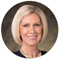
ដោយស៊ីស្ទើរ ចយ ឌី ចូនស៍ ប្រធានអង្គការបឋមសិក្សាទូទៅ