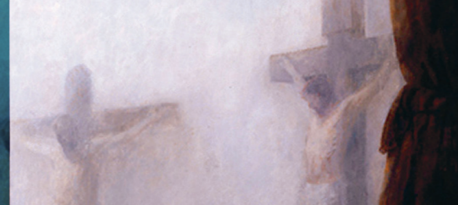
THE GOOD SHEPHERD, GREY DW. GOLGOTHA (ĐÁNG CHẤM HIỆN LÀNH ĐỒ, SỐ NGÀY LI AM) VÀ EVERY KNEE SHALL BOW (MỌI ĐẦU GỐI SẼ PHẢI QUỲ XUỐNG) ĐỒ J. KIRK RICHARDS HOA EMPTY GARDEN TOMBS (MỒ VƯỜN TRỐNG KHÔNG) TRANH ĐỒ STEVE HART HOA