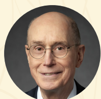
President Henry B. Eyring Tweede raadgever in het Eerste Presidium