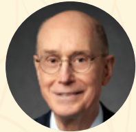
Írta: Henry B. Eyring elnök második tanácsos az Első Elnökségben