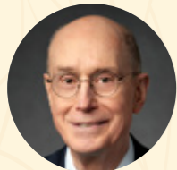
Presidente Henry B. Eyring Secondo consigliere della Prima Presidenza