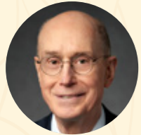
Президент Генри Б. Айринг Второй советник в Первом Президентстве