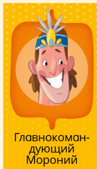
Главнокоман- дующий Мороний