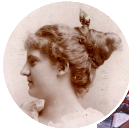
청녀가 청녀 매달은 최고 있는 사본: 안티리아 세르바 필라미에너의 형인 영웅 건드 이는 청소년들 청녀의 몸 모양

발전과 표창: 프로그램에서 달성할 수 있는 최고 표창으로 골든 글리너 표창이 있다.