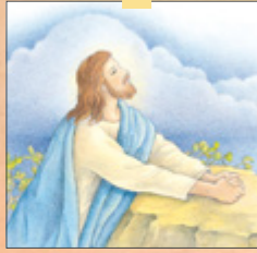
Sii mai le “O le Tusi a Mamona o se Taiala Patino,” Liahona, Set. 2010, 4–6.

O taimi taitasi ou te faitau ai e tusa lava pe na o ni nai laina i le Tusi a Mamona, ou te lagonaina le faamalosiā o la’u molimau e moni le tusi, o Iesu o le Keriso, ma e mafai ona tatou mulimuli ia te Ia e toe foi atu ai. Mo au lava ia, o le tusi lea o tusi. O le afioga a le Atua.