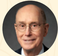
Ni Pangulong Henry B. Eyring Pangalawang Tagapayo sa Unang Panguluhan