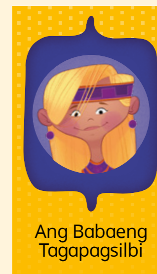
Ang Babaeng Tagapagsilbi