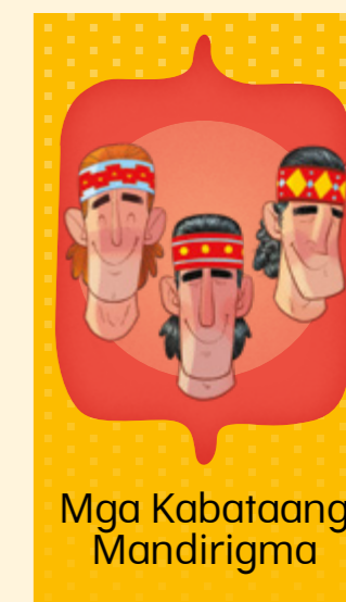
Mga Kabataang Mandirigma