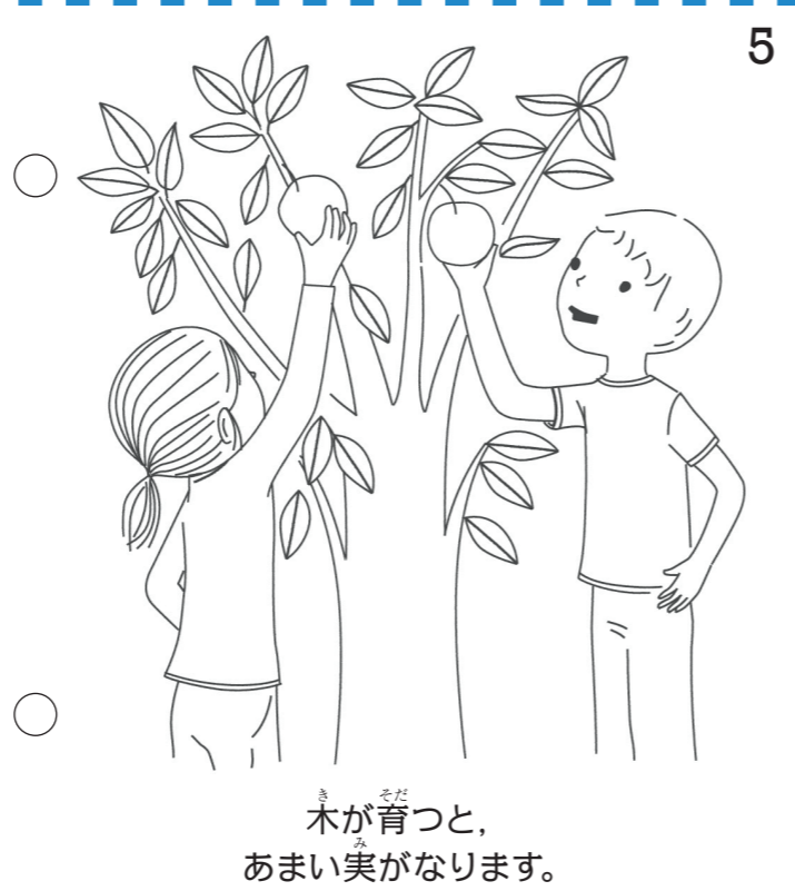
木が育つと、 あまい実がなります。