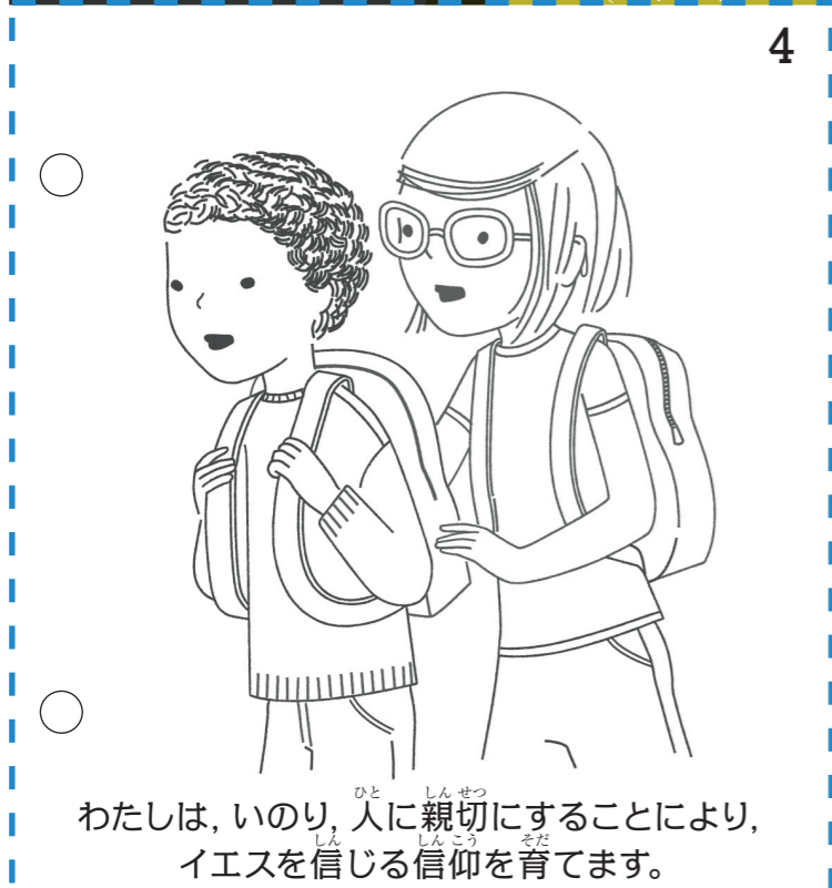
わたしは、いのり、人に親切にすることにより、 イエスを信じる信仰を育てます。