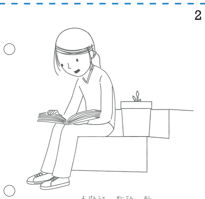
わたしは、預言者と聖典の教えに 耳をかたむけることにより、自分の信仰の種を 植えることができます。