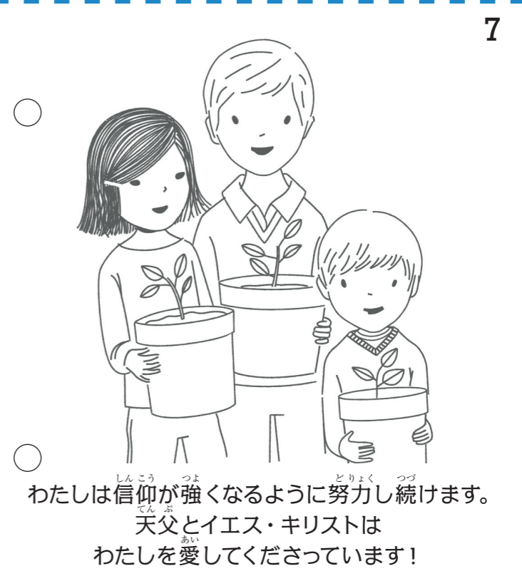
わたしは信仰が強くなるように努力し続けます。 天父とイエス・キリストは わたしを愛してくださっています!