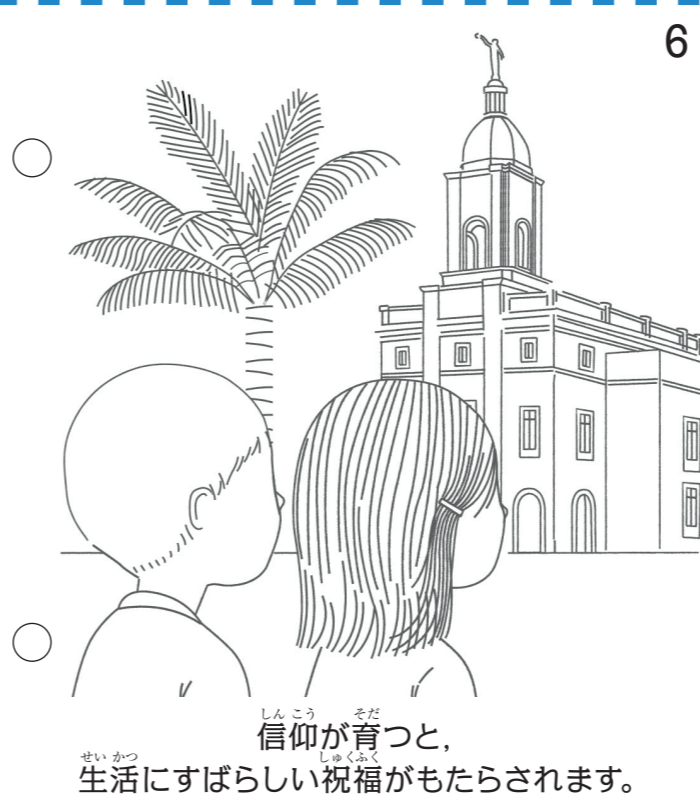
信仰が育つと、 生活に素晴らしい祝福がもたらされます。