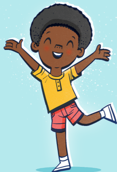
houd je er geen schadelijke gewoonten op na;