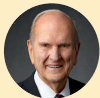
President Russell M. Nelson