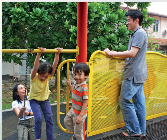
Keluarga betekent 'gezin' in het Maleis. Dit gezin gaat graag samen naar de speeltuin.

Maleisië is een heel mooi land in Zuidoost-Azië. De kerk in Maleisië telt ongeveer 10.000 leden in 33 gemeenten. De kerk is hier klein maar krachtig.