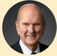
Presidentti Russell M. Nelson