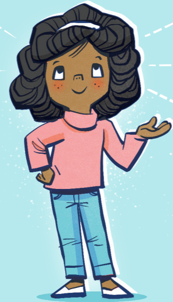
siunaa sinua valolla ja ilolla

Sinä olet Jumalan lapsi. Jumala antaa meille käskyjä siunatakseen meitä ja tuodakseen meille iloa. Toisinaan ihmiset valitsevat, mitä käskyjä he noudattavat ja mitä eivät. Se, että yrität olla kuuliainen kaikille Jumalan käskyille