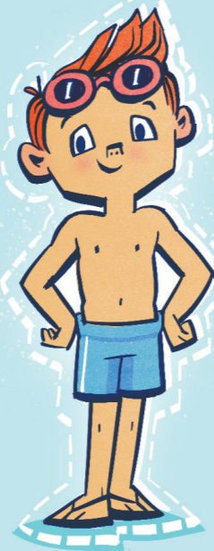
Védi a testedet.