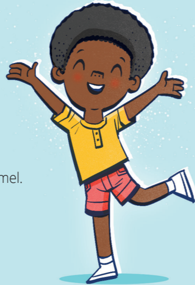
Segít, hogy ne légy káros szokások rabja.